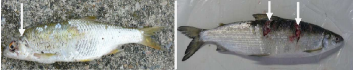
Fig. 1 a et b: Poissons blessés. Le gardon à gauche a été blessé par un cormoran. On reconnaît clairement le coup porté par le bec crochu au niveau des yeux et de l'opercule des ouïes, endroit typique des blessures infligées par les cormorans à des petits poissons (1a). Lorsqu'il s'agit de poissons plus grands comme le corégone de droite (1b), il est fréquent que les blessures se situent exclusivement ou en plus le long du corps; on observe là aussi des lésions profondes d'un seul côté du poisson.