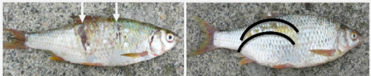
Fig. 3a et b: La forme des lésions aide à faire la distinction entre les blessures dues à un cormoran et celles infligées par des poissons carnassiers. Le gardon de gauche (3a) a été saisi de dos par un brochet, dont les deux rangées de dents ont laissé des marques typiques; la région de l'ouïe et de l'œil est par contre indemne. Le gardon de droite (3b) a été mordu par un silure attaquant côté ventre. On voit nettement le contour de la mâchoire inférieure garnie de dents minuscules formant des râpes (entre les deux lignes rouges). Contrairement au cormoran et au brochet, le silure ne fait pas de lésions profondes.